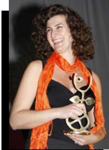
جائزة لجنة التحكيم الخاصة، 10-11، بيلين إسمر، تركيا

Prix spécial du Jury: 10-11, Pelin Esmer, Turquie